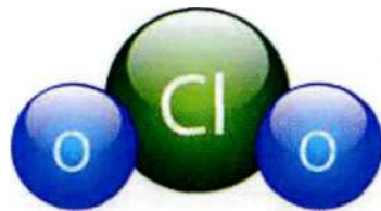
Das Chlordioxid-Molekül (CD)