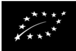
Das europäische Biosiegel

Seit dem 1. Juli 2012 gibt es das EU-Bio-Siegel. Es ist der Mindeststandard für den ökologischen Anbau in Europa und muss auf allen vorverpackten Lebensmitteln angebracht sein, die in der EU als Bioprodukte erzeugt und verkauft werden. Zum Siegel gehören Informationen über die Herkunft der Zutaten und die Angabe der Codenummer der Öko-Kontrollstelle.