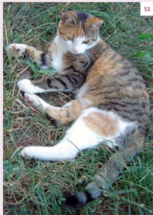
Dieselbe Katze »mit gezückter Kralle« ein Jahr später.