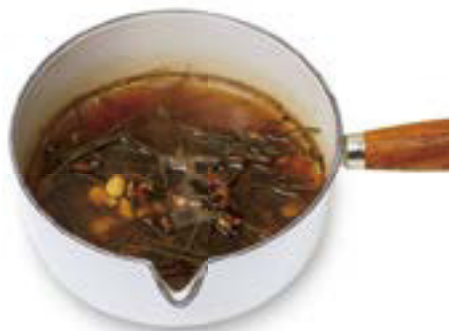
1 Kräuter in einen Topf geben, mit kaltem Wasser bedecken und zum Kochen bringen. 20–30 Minuten köcheln lassen, bis die Flüssigkeit um ein Drittel reduziert ist.

In der TCM stellen Abkochungen die Hauptdarreichungsform für Kräuterarzneien dar. Große Mengen Heilpflanzen werden oft zur Herstellung hochkonzentrierter Flüssigkeiten verwendet. Oder die Abkochung wird so weit eingedampft, dass nur noch etwa 200 ml übrig bleiben. Auch dies erhöht die Konzentration der Abkochung – ein wünschenswerter Effekt etwa bei der adstringierenden Rinde von Gummiarabikumbaum ( Acacia nilotica , S. 159) oder Stieleiche ( Quercus robur , S. 260), deren Abkochung äußerlich als Zahnfleischspülung oder Waschlotion verwendet wird.