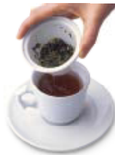
2 Tasse abdecken, 5–10 Minuten ziehen lassen und den Einsatz herausnehmen. Je nach Geschmack mit 1 TL Honig süßen.