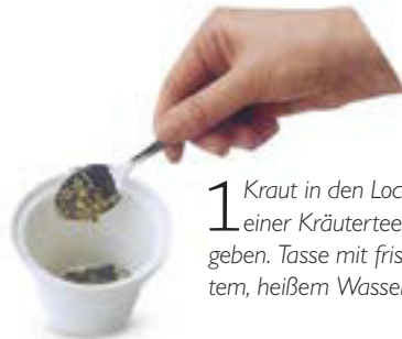
1 Kraut in den Locheinsatz einer Kräuterteetasse geben. Tasse mit frisch gekochtem, heißem Wasser füllen.

Kräutertees wie Kamillentee werden oft wegen ihres Geschmacks, seltener wegen ihres medizinischen Nutzens getrunken. Man kann getrost 5–6 Tassen täglich trinken. Andere Kräuter, wie etwa Schafgarbe ( Achillea millefolium , S. 56), wirken stärker und sollten in geringerer Dosis eingenommen werden. Das Mutterkraut ( Tanacetum parthenium , S. 140) ist dagegen so stark, dass es sich nicht für einen Aufguss eignet. Man sollte stets auf die Dosis und Kräutermenge achten.