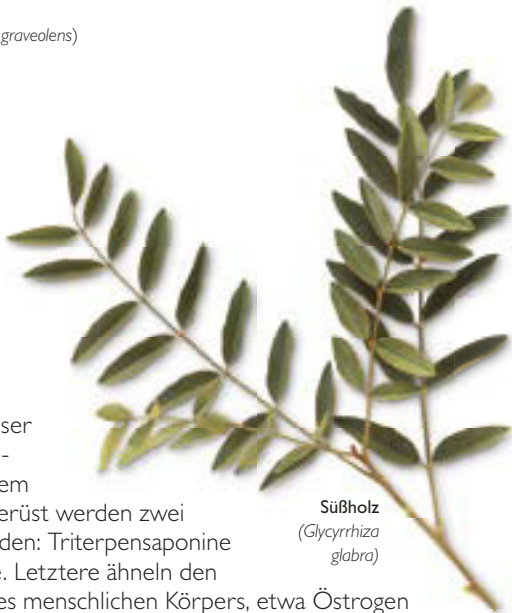
Süßholz ( Glycyrrhiza glabra )

Die in vielen Pflanzen enthaltenen Kumarine können recht unterschiedliche Wirkungen haben. So verdünnen die des Steinklees ( Melilotus officinalis , S. 234) und der Gemeinen Rosskastanie ( Aesculus hippocastanum , S. 58) das Blut, während Furanokumarine, etwa das Bergapten aus Sellerie ( Apium graveolens , S. 64), in Sonnenschutzmitteln verwendet wird. Das im Zahnstoeckerkraut ( Ammi visnaga , S. 62) vorkommende Khellin ist dagegen ein wirksames Relaxans für die glatte Muskulatur.