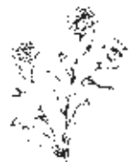
Ringelblume ( Calendula officinalis )

Die Haut als größtes Organ des Körpers schützt ihn vor Hitze, Kälte, Infektionen und Verletzungen. Obwohl sie regelmäßig ihre äußerste Zellschicht erneuert, muss sie stets gereinigt und gepflegt werden, um gesund zu bleiben. Die Gesundheit des ganzen Organismus entscheidet, wie widerstands- und regenerationsfähig die Haut ist. Während kleinere Hautleiden rasch auf äußere Behandlung ansprechen, müssen schwere oder chronische Hautkrankheiten von innen und meist auch vom Facharzt behandelt werden. Siehe auch »Ekzeme«, S. 300.