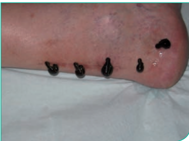
Ansetzen der Blutegel auf Verwachsungen nach einer Achillessehnen-Operation

Die Achillessehnenentzündung ist mit Blutegeln sehr gut behandelbar. Die Egel werden lokal angesetzt. In der Regel werden 4-8 Egel in das betroffene Gebiet gesetzt. Je nach Reaktion des Patienten kann es notwendig sein, die Behandlung mehrmals zu wiederholen.