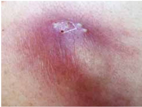
Abb. 45: Karbunkel

Durchmesser bis zu 13 cm oder mehr. Junge Personen oder solche mit robustem Naturell werden nur selten befallen. Beim Karbunkel treffen mehrere Furunkel und gangränöse Veränderungen aufeinander. Prädilektionsstellen sind die Haut entlang der Wirbelsäule, das Genick, inguinal und sternal. Karbunkel können bei abgemagerten und robusteren Menschen auftreten. Der Krankheitsverlauf steht meist mit großen Schmerzen in Verbindung.