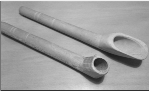
Türkische Windelspeifen: Die obere ist für Mädchen, die untere für Jungen

Na, und da ich diese Windeln haben wollte, beschloss ich, das Buch nun umgehend zu beginnen.