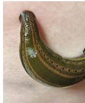
Saugender Hirudo medicinalis