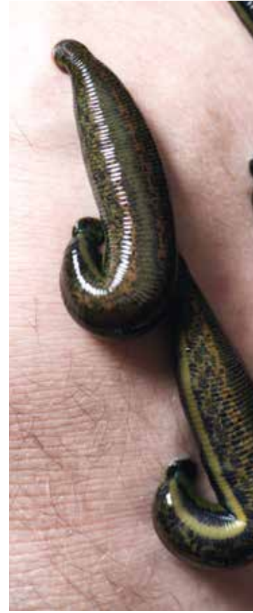
Frei saugender Blutegel

gewappnet. Erst wenn der Blutegel sich von dem Opfer gelöst hat, können sie, ihre Körpersubstanz verbraucht, wieder zum Beissen an ein neues Opfer zu suchen. Ein Blutegel, der länger als 3 Monate ( >3 Monate) wieder zum Beissen fähig ist, hat eine vollere therapeutische Qualität als ein junges Tier. Daher werden in der Praxis zeitliche Abstände zur letzten Blutentnahme von 4–5 Monaten empfohlen.