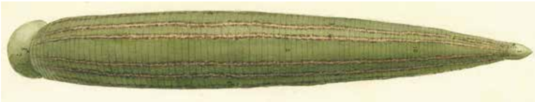
Originalaquarell von J. Anglas, La sangsue, anatomie et dissection, 1916

Nach einer ausgiebigen Blutaufnahme können die Egel lange Zeit ohne Nahrung auskommen. Sie benötigen vor allem Ruhe und sind für Hungerperioden