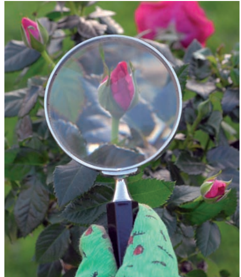
Abb. 1.7a: Kontrolle des Befalls.