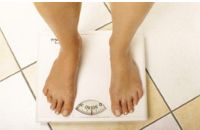
Die Waage muss nicht Ihr Feind bleiben.

Bauch, Beine und Po sind für gewöhnlich die Problemzonen der Frau. Wäre es nicht schön, das Fett genau an diesen Stellen gezielt abtrainieren zu können? Doch so einfach ist es leider nicht.