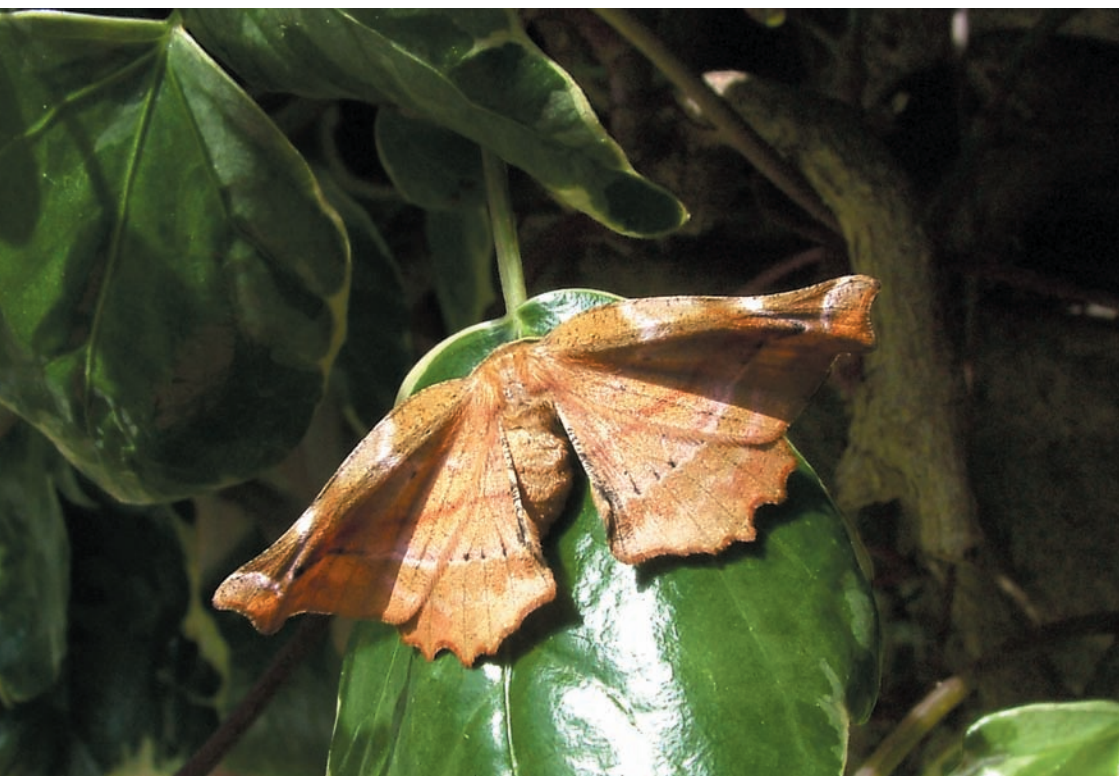
Apeira syringaria – Belleza de las lilas