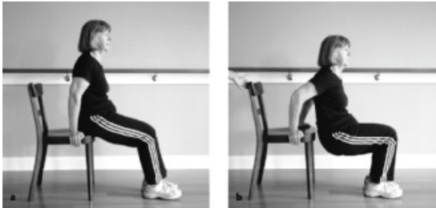
► Abb. 12.15 Ellenbogenextensoren - Armstrecker.

Durch weiteres Wegstellen der Füße wird die Übung anstrengender.