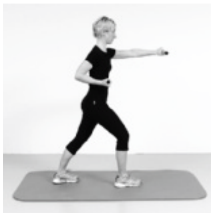
► Abb. 12.17