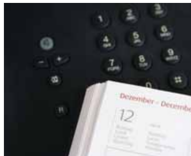
Friederike Malek – Einführung