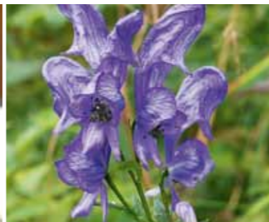
Bernd Müller-Thederan – Interview