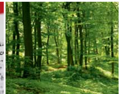
Volker Weis – Neurodermitis