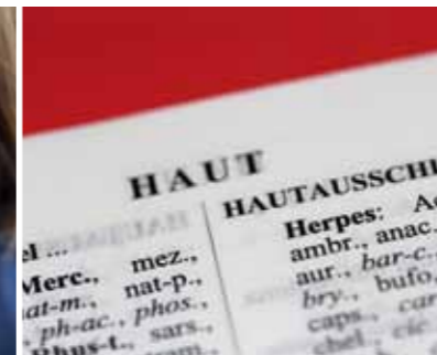
Dieter Till – Herpetiforme Effloreszenz