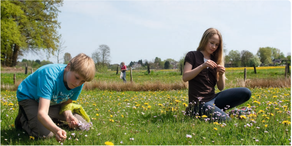
Aus vielen Löwenzahnblüten wird ein feiner Löwenzahnsirup.