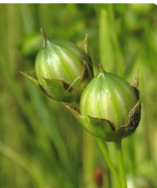
Die Fruchtkapseln des Leins.