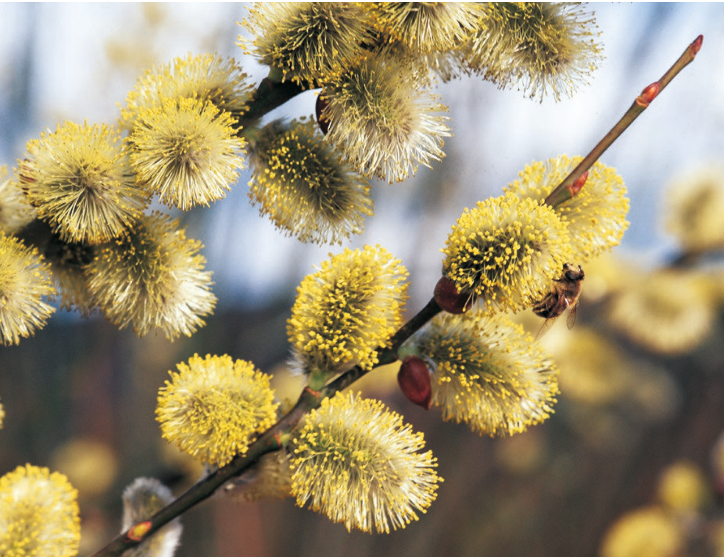
Die salizinhaltige Weidenrinde lindert chronische Schmerzen.