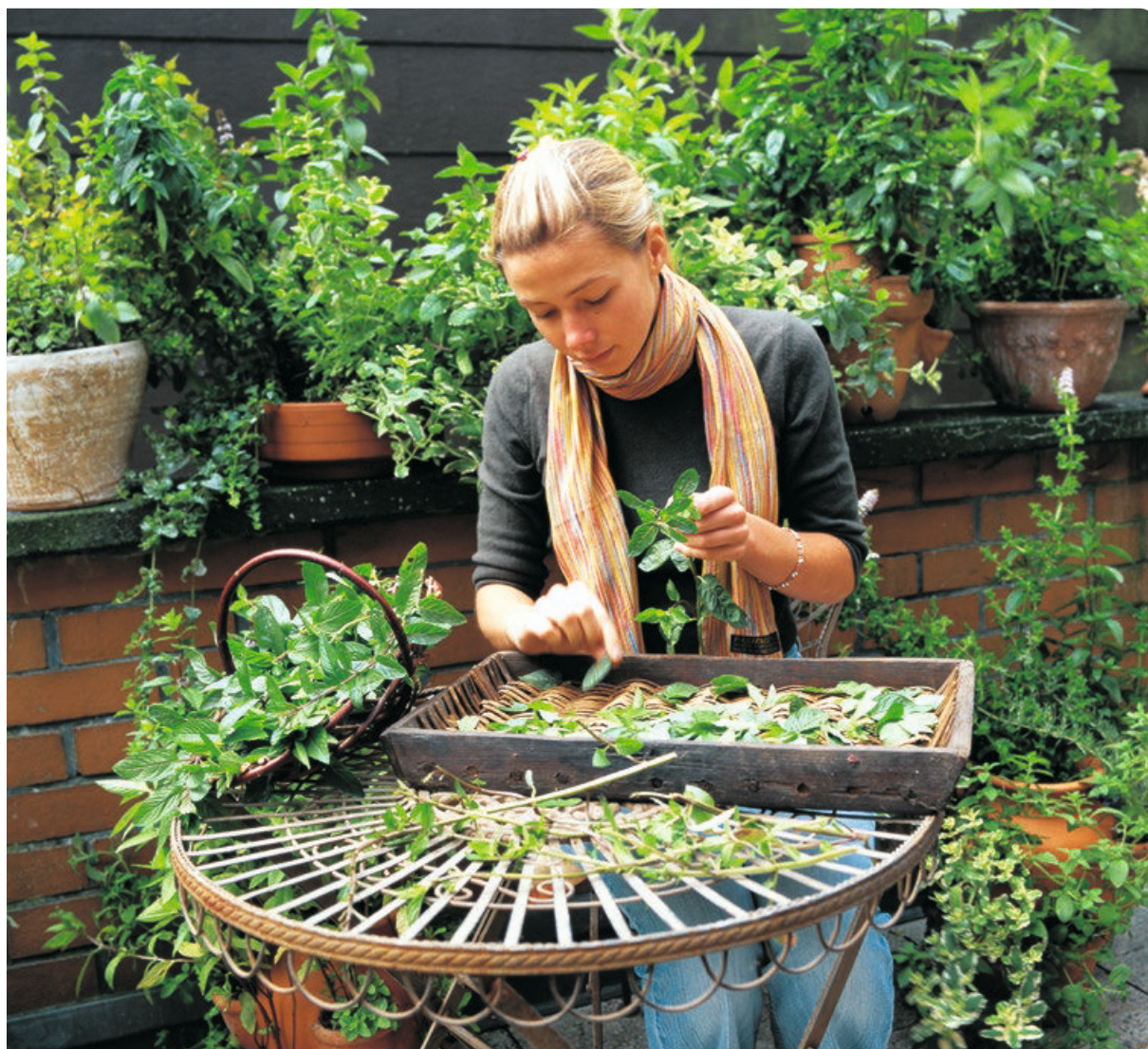
Die Blätter werden zum Trocknen gleich nach der Ernte vom Stängel gezupft.

Samen sammeln Sie zur Mittagszeit, dann ist ihr Wirkstoffgehalt am höchsten. Wurzeln ernten Sie am frühen Morgen, weil nachts viele Wirkstoffe in die Wurzel zurück fließen und erst morgens wieder in die oberen Pflanzenteile hoch strömen. Wollen Sie auf den Mond achten, besorgen Sie sich dazu entsprechende Mond- oder Aussaatkalender. Hier sind die Blatt-, Blüten-, Frucht- und Wurzeltage angeben.