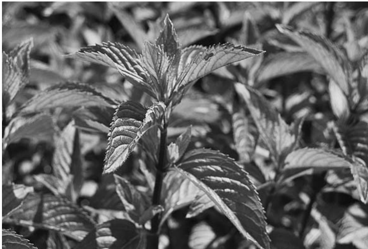
Abb. 2.2 Pfefferminze.