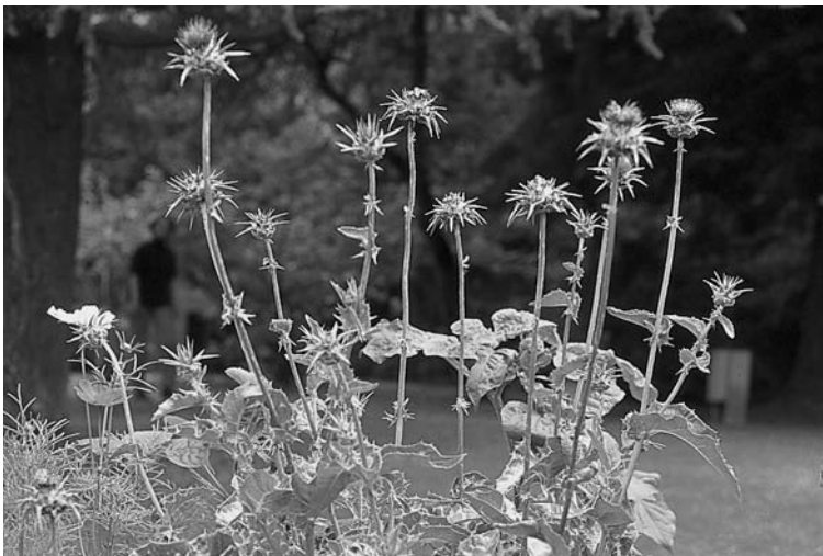
Abb. 3.1 Mariendistel.

3.1.5 Kurzsteckbrief der Mariendistel – Füllen Sie die leeren Zellen der Tabelle aus.