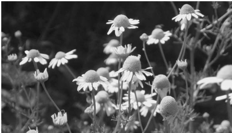
Abb. 2.1 Kamille.