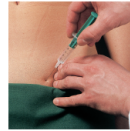
Frankenhäuser Plexus (Nackel nach medial und kaudal vorschieben)