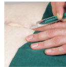
Narben (subkutan untergespritzt)