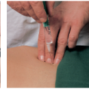
Frankenhäuser Plexus (senkrecht einstechen)