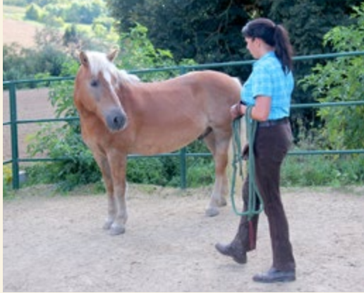
Erst wenn es mir entgegenblickt, gehe ich weiter auf das Pferd zu.