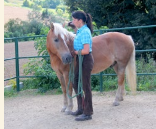
Zu guter Letzt kann ich ihm das Halfter anlegen.

Anspannung im Körper des Pferdes. Sie können aber auch, beispielsweise durch leichtes Schlagen Ihrer Hand auf Ihr Bein, versuchen die Aufmerksamkeit für sich zu gewinnen.