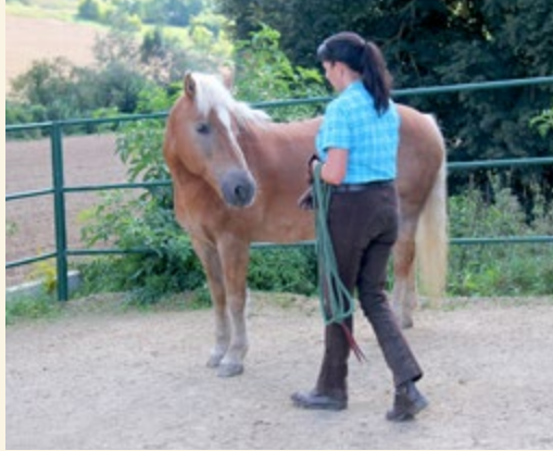
Solange es mir entgegenblickt, kann ich nun zu ihm laufen, es an mir schnuppern lassen und es begrüßen.