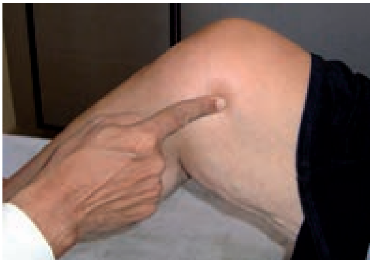
Abbildung 12: Untersuchung des Janu Marma am Knie.

Janu Marma / Kurpara Marma. Dies sind Sandhi -Marmas an den Knien bzw. Ellbogen. Sie sind drei Fingerbreit groß, ca. 3 bis 6 cm. Das Janu Marma (Knie-Marma) kann an der Mitte des Kniegelenks ertastet werden, wo der Oberschenkelknochen auf das Kniegelenk trifft. Das Bein sollte leicht gestreckt sein, der Daumen bewegt sich mit festem Druck kreisförmig an der Kniescheibe entlang.