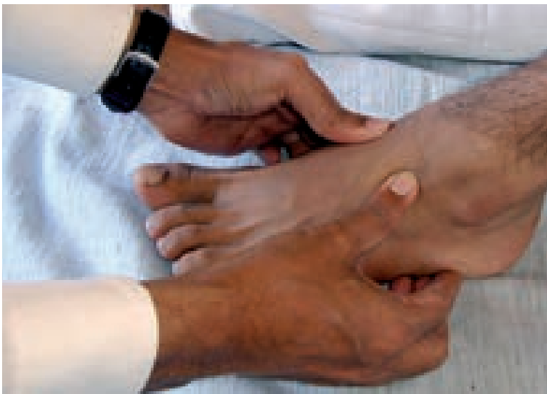
Abbildung 11: Untersuchung des Kurcha Marma am Fuß.

Kurcha Marma. Kurcha heißt wörtlich „Pinsel“. Das bezieht sich auf die Mittelhand- bzw. Mittelfußknochen und die Sehnen, die sich an der Hand- bzw. Fußwurzel treffen und sich dann fächerförmig ausbreiten. Das Kurcha Marma gehört zu den Snayu -Marmas und ist vier Fingerbreit, also ca. 4 bis 8 cm, lang. Diese Marmas können besser am Hand- bzw. Fußrücken ertastet werden. Man lokalisiere zuerst das Kshipra Marma und bewege dann den Finger langsam in Richtung Handwurzel und zur Mitte des Handrückens bzw. in Richtung Fußwurzel und zur Mitte des Fußrückens. Das Kurcha Marma befindet sich etwa zwei Fingerbreit nach oben und zur Mitte hin vom Kshipra Marma entfernt. Unter ihm liegen die Bänder zwischen den Mittelhand- bzw. Mittelfußknochen, die Gelenke dieser Knochen mit den Hand- bzw. Fußwurzelknochen und ein Zweig der Speichen- bzw. Schienbeinarterie.