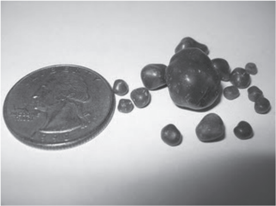
Abb. 15: Bilirubinsteine

Es ist möglich, dass einige dieser Steine in die größeren Gallengänge gelangen und sich dort wieder mit anderen Steinen verbinden oder selbst zu größeren Steinen heranwachsen. So wird mit der Zeit der Gallenfluss auch in den größeren Gallengängen immer stärker beeinträchtigt. Sind erst einmal mehrere der größeren Gallengänge mehr oder weniger blockiert, zieht dies wiederum Hunderte von kleineren Gängen in Mitleidenschaft und der Teufelskreis schließt sich.