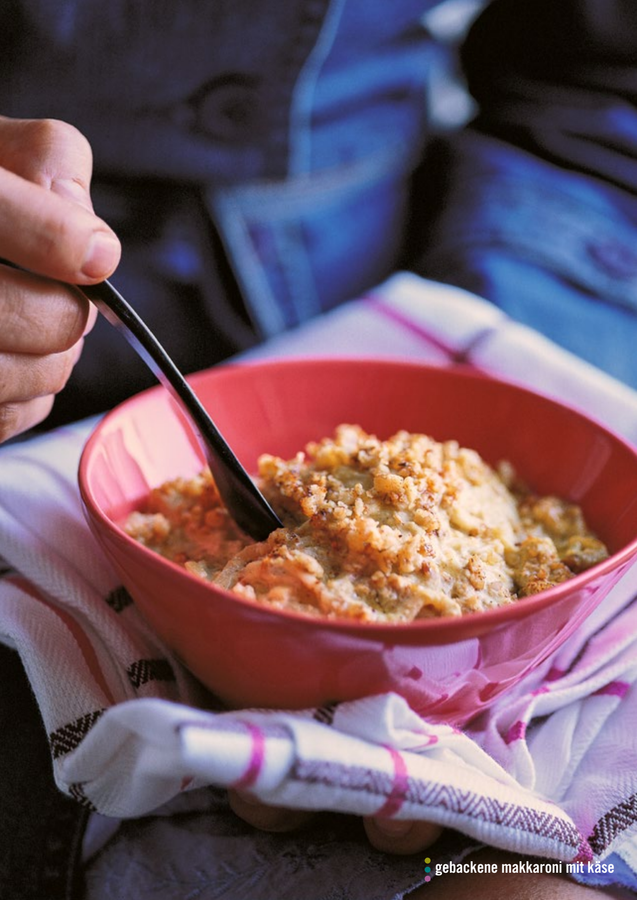
gebäckene makkaroni mit käse