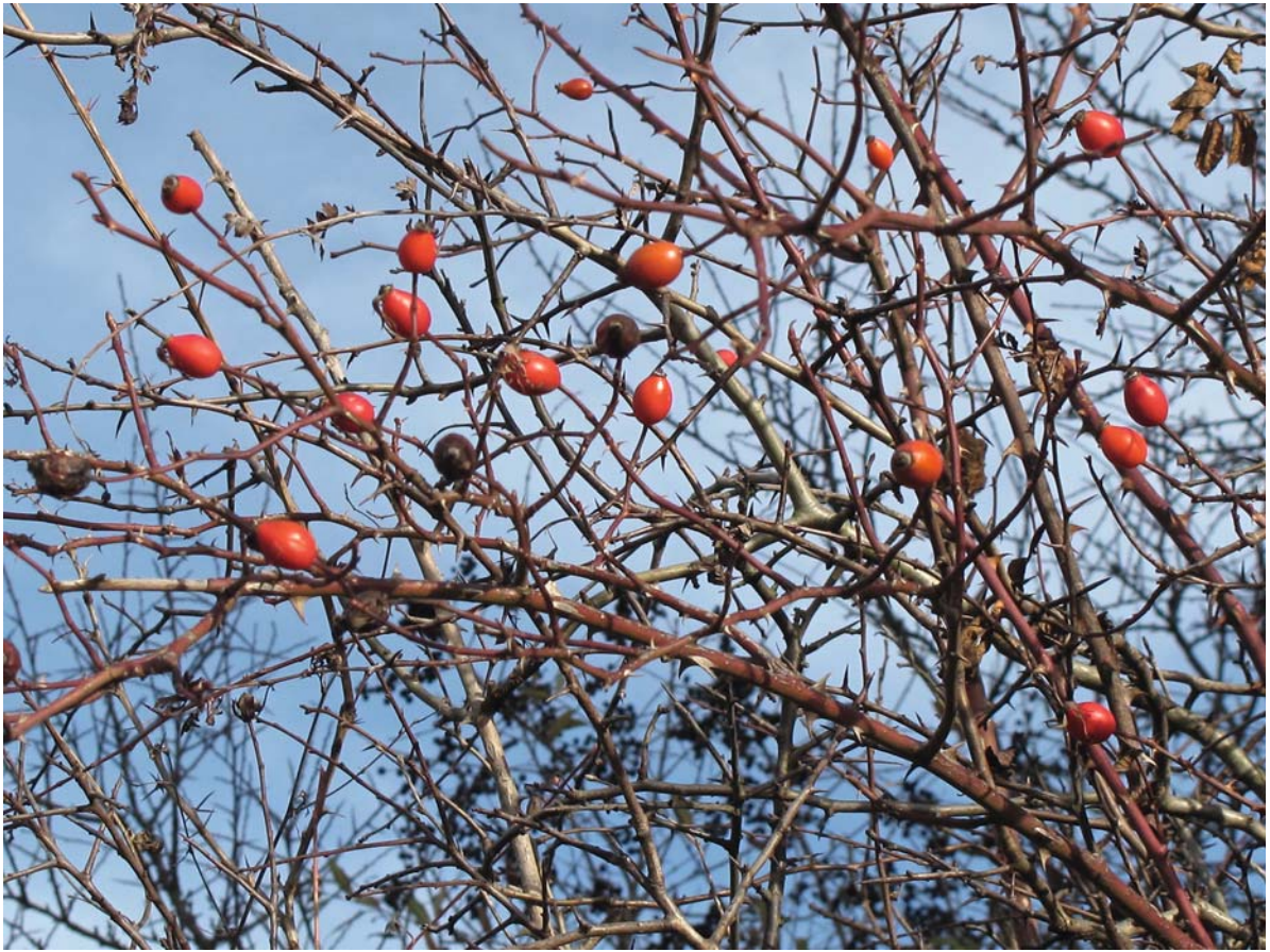
► Abb. 13.114 Rosa canina (Heckenrose) im Winter.

der Sonne entgegen. Die Blüten haben fünf Kron- und fünf Kelchblätter. Als Eigenart gilt, dass die Kelchblätter an der gleichen Blüte sehr unterschiedlich gestaltet sind – mal gelappt, dann mit glattem Rand, manche kahl, andere bewimpert (► Abb. 13.113 ).