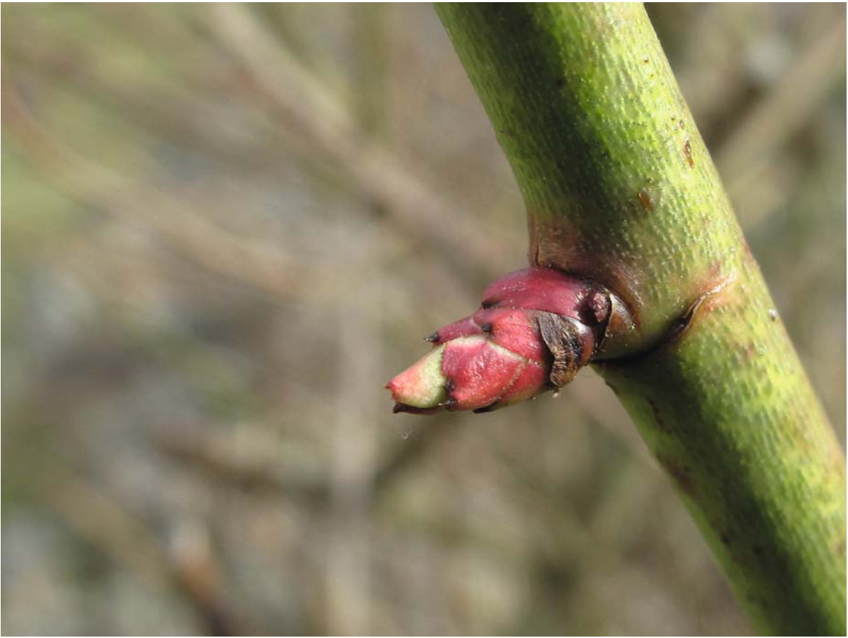
► Abb. 13.115 Rosa canina (Heckenrose) – Seitenknospe.

Getrocknete und pulverisierte Blütenblätter gab man als Umschlag auf Wunden und Geschwüre, frische taunasse Blütenblätter legte man auf die Augen, um diese mit ihrer erfrischenden Wirkung aufzuklären.