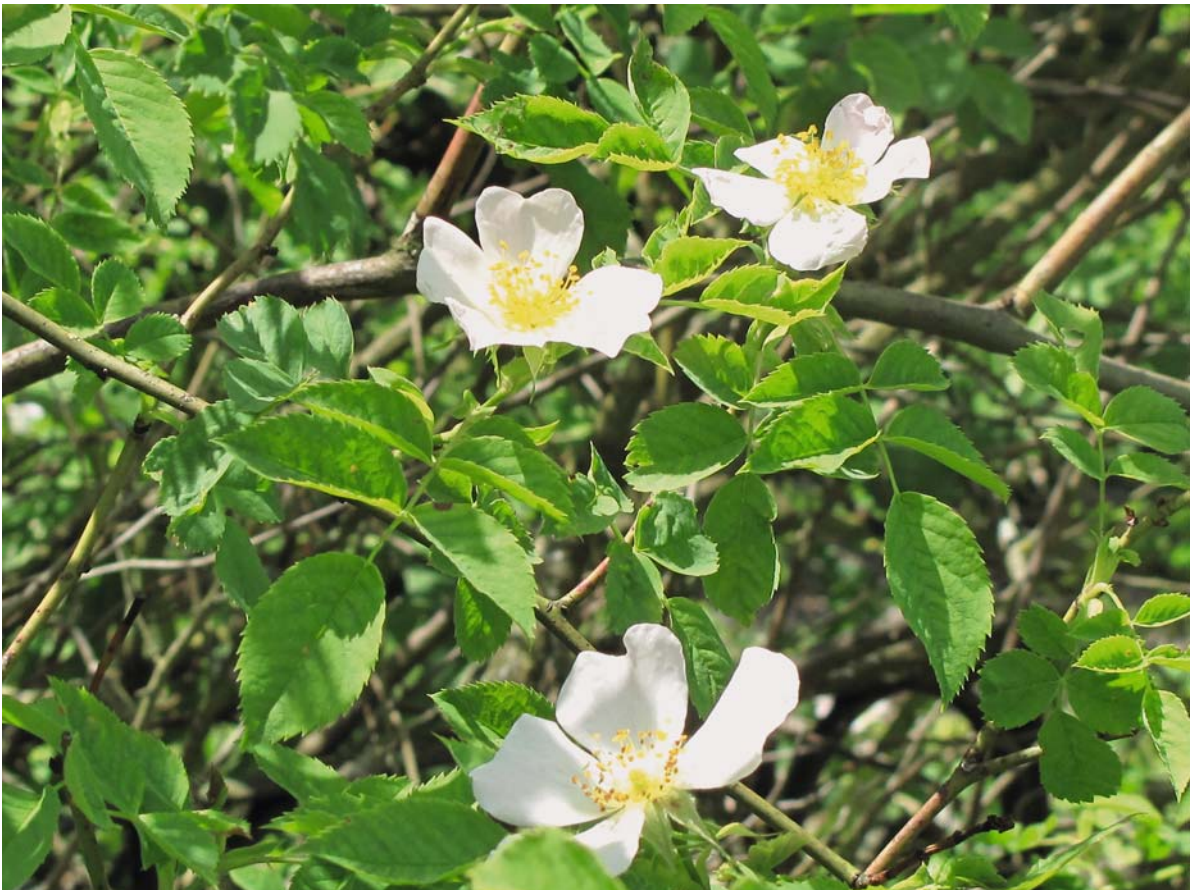
► Abb. 13.113 Rosa canina (Heckenrose) im Frühlingskleid.

Von Mai bis Juni streckt die Heckenrose ihre weißen bis hellrosa Blüten mit den vielen gelben Staubblättern