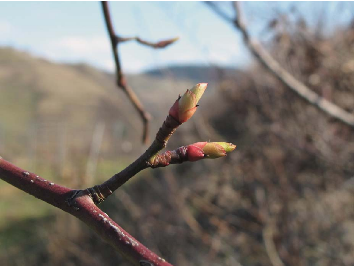
► Abb. 13.116 Rosa canina (Heckenrose) – Endknospen.

Als Mittel gegen rheumatische Beschwerden hilft Rosa canina insbesondere dann, wenn die Symptomatik keine Verschlechterungstendenz im Winter oder bei kaltem Wetter aufweist, also keine Temperaturabhängigkeit zeigen.