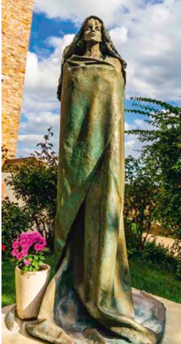
„Wie die sprossende Grüne der Erde will ich wirken.“ Hildegard von Bingen, Scivias

Eines ist gewiss: Wir brauchen Grün zum Atmen und Leben. Wir brauchen Chlorophyll, und wir brauchen lebendige Nahrung. Beides ist in der allgemein üblichen Ernährung eher Mangelware, was zu einem wahren Heißhunger führt, der viel zu oft und viel zu reichlich mit degenerierten Nahrungsmitteln zu stillen versucht wird. Dabei kann es ganz einfach sein: Im grünen Smoothie liegt dir die grüne Kraft des Chlorophylls in einer Form vor, wie sie besser gar nicht vom Körper aufgenommen werden könnte. Wenn du diesen aus frisch gesammelten Pflanzen trinkst, bekommst du eine tolle Fülle an Biotin, Vitaminen und Mineralstoffen.