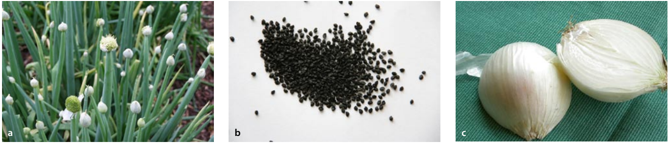
Abb. 9.4a–c Allium cepa L.; Küchenzwiebel (a Pflanze, b Samen, c Zwiebel)

Deutsch ▶ Küchenzwiebel , Englisch ▶ onion , Sanskrit ▶ palāṇḍuḥ , Hindi ▶ pyāj , Malayalam ▶ cuvannuḷli , Tamil ▶ veṅkāyam, iruḷli