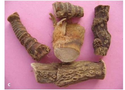
■ Abb. 9.2a–c Acorus calamus L. (Acoraceae); Kalmus (a, b Pflanze, einzeln und im Verbund; c getrocknetes Rhizom)

Deutsch ▶ Kalmus , Englisch ▶ sweet flag , Sanskrit ▶ vacā, ugragandhā, ugrā, ṣaḍgranthā , Hindi ▶ bacc, gorabācc , Malayalam ▶ vayāmpu , Tamil ▶ va-śāmpu