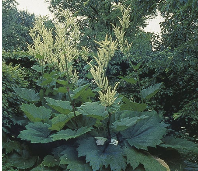
■ Abb. 10.4 Medizinalrhabarber, Pflanze mit Blütenrispen

blätter sind kürzer gestielt, die obersten fast sitzend. Die zahlreichen Blüten sind in endständigen Rispen vereinigt. Die Blütenhülle besteht aus 6 freien weißen, rosa oder roten Perigonblättern. Die Blütenblätter werden bei der reifen Blüte weit nach hinten geschlagen, wodurch die 9 Staubblätter und die Narbe für die Windbestäubung frei werden. Die Frucht ist eine 3-wandige, braune, breitflügelige Nuss. Blütezeit: Mai–Juni.