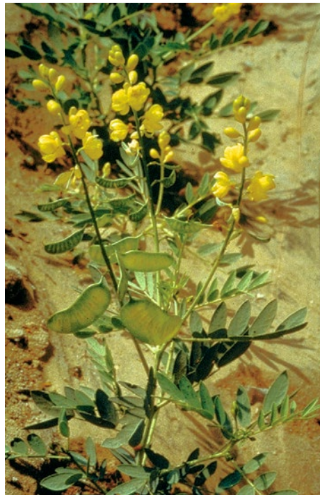
■ Abb. 10.6 Sennespflanze, blühende Pflanze mit Früchten

Botanik/Herkunft Bei Senna alexandrina handelt es sich um einen 0,6–1,5 m hohen Strauch oder Halbstrauch (■ Abb. 10.6). Der Stängel ist vom Grund an verzweigt. Die Blätter sind wechselständig, unpaarig gefiedert, mit 4–6 Paaren fast sitzenden, lanzettlichen, ganzrandigen, zugespitzten, nackten Fiederblättchen, die beim Alexandriener-Senna (früher C. senna ) 2–3 cm lang und 1 cm breit, beim Tinnevelly-Senna (früher C. angustifolia ) 2,5–6 cm lang und 1–2 cm