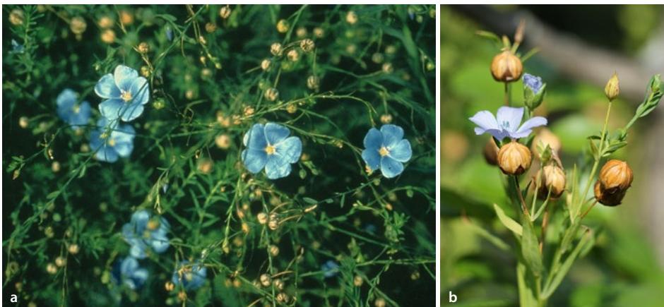
■ Abb. 10.3a,b Lein, a Pflanze mit himmelblauen Blüten, b Blüten und Früchte

Der Lein ist eine der ältesten Kulturpflanzen der Welt. Er wird als Faser- und Ölpflanze angebaut. Drogenimporte stammen überwiegend aus Kulturen in Argentinien, Belgien, Holland, Indien, Kanada, Marokko, Rumänien, Russland, Ungarn und USA (Leng-Peschlow 2014).