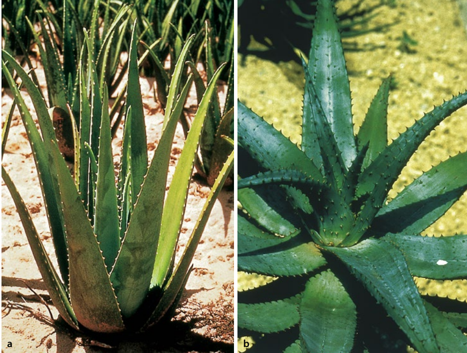
▣ Abb. 10.1 a Aloe vera, b Aloe ferox

Beere. Aloe ferox ist eine mehrjährige Pflanze mit vielen endständigen Blattrosetten aus großen, fleischigen, hellblaugrünen, dunkelgrünen oder rötlichen, lanzettlichen Blättern mit einigen kurzen, stacheligen Zähnen. Die etwa 3 cm langen Blüten sind gelb mit grünlichem Rand, tief 6-lappig. Der Stamm ist von etwa 10 cm Dicke und wird bis zu 6 m hoch.