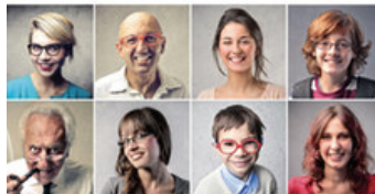
Ein neues und tiefgehendes Verständnis von 40 grossen Mittel-Persönlichkeiten