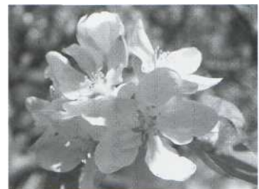
Holzapfelblüte (Malus domestica)