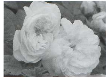
Damaszener-Rose 'Madame Hardy'