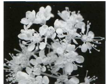
Mädesüß (Spirea ulmaria, Filipendula ulmaria)