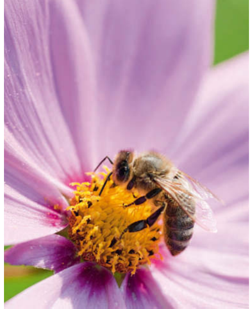
Apis mellifica , die Honigbiene, hilft bei Insektenstichen mit blassroter Schwellung.

Beschwerden schlimmer: durch Hitze oder auch nur Wärme; bei Berührung oder Druck; durch heiße Getränke; nach dem Schlaf und am Spätnachmittag.