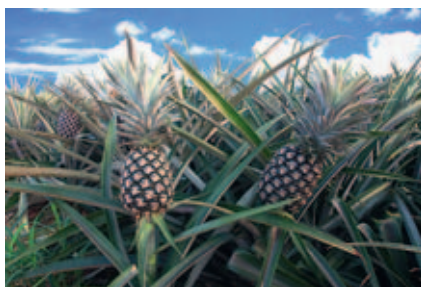
Abb. 2.34 Ananas ( Ananas comosus L. MERRILL) [J787]