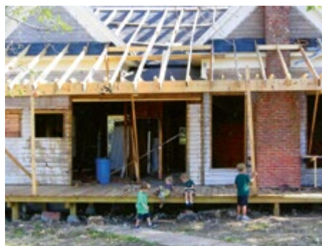
DAS FARMHAUS WÄHREND DER RENOVIERUNGEN.