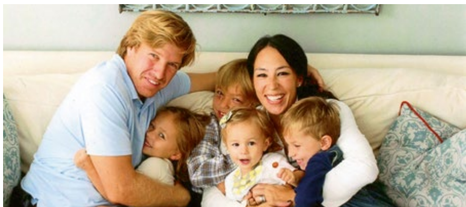
FAMILIENFOTO IM »SHOTGUN«-HAUS.