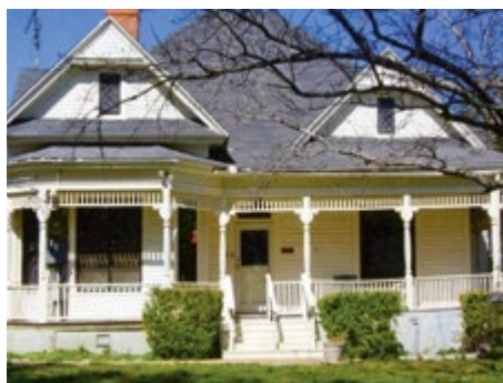
DAS FARMHAUS VOR DER RENOVIERUNG. (VERSTEHEN SIE, WARUM WIR UNS IN DIESES SCHMUCKSTÜCK VERLIEBT HABEN?)