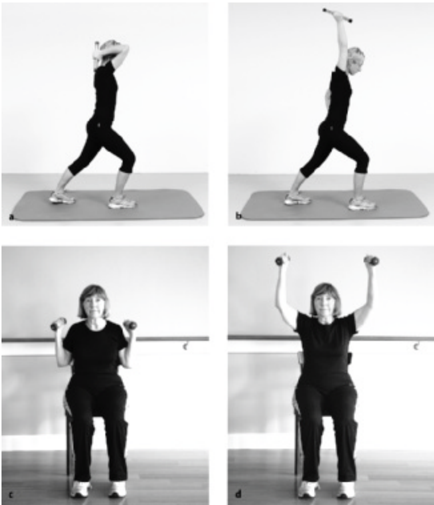
► Abb. 12.14 Ellenbogenextensoren in Schulterflexion.