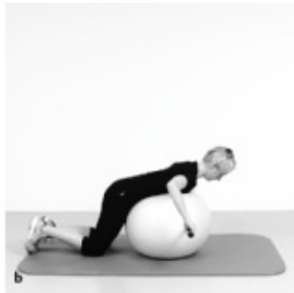
► Abb. 12.16 Rowing auf dem Ball.