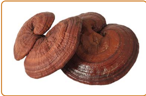
▶ Abb. 5.13 Reishi. (Anndylian)