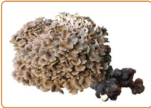
► Abb. 5.12 Polyporus umbellatus. (Dr. László Németh und Gerhard Schuster, Bad Sooden-Allendorf)