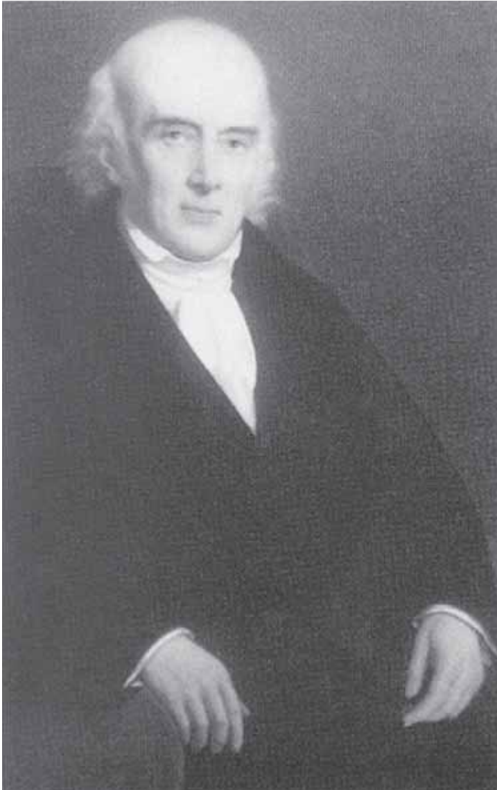
D r. C hristian F riedrich S a m u e l H a h n e m a n n