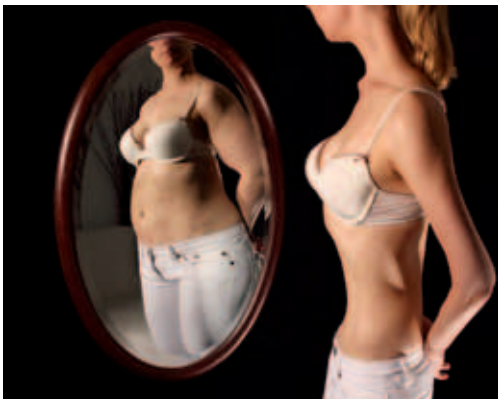
Abb. 9.1 Körperschemastörung.