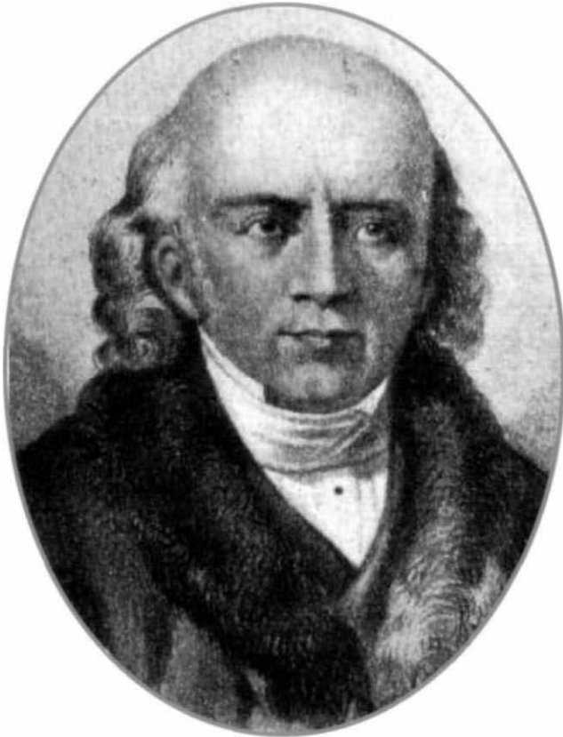
Christian Friedrich Samuel Hahnemann