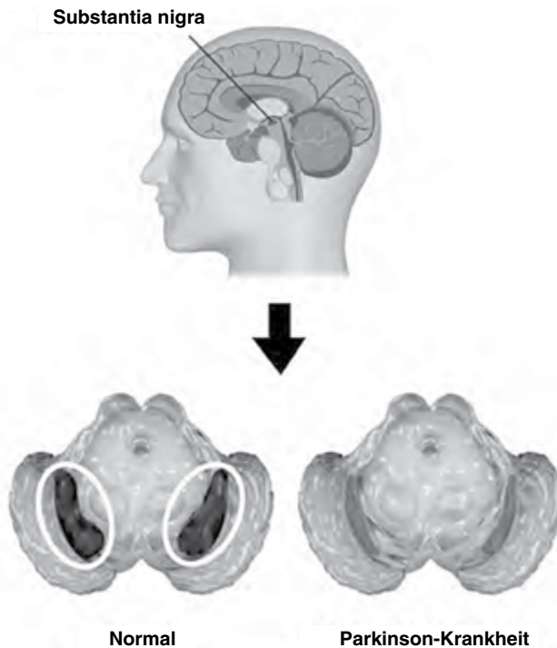
Abbildung 1.3. Die Substantia nigra (lateinisch für „schwarze Substanz“) bei Personen ohne und mit Parkinson-Krankheit. Bei der Parkinson-Krankheit ist die Substantia nigra eine der Schlüsselregionen im Gehirn, in der Zellen absterben.