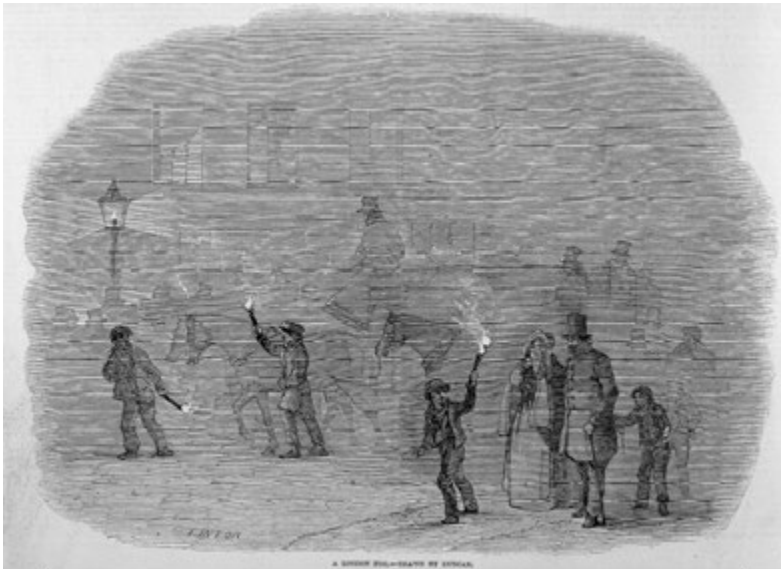
Abbildung 1.1. Darstellung des Londoner Nebels, 1847.

Einem Umweltforscher zufolge „ist es schwierig, das Ausmaß der Luftverschmutzung in London während des gesamten 19. Jahrhunderts vollständig zu erfassen.“ 4 Der von der Industrie herrührende Londoner Nebel (Abbildung 1.1) war „oft so dicht, dass er [...] die allgemeinen wirtschaftlichen Aktivitäten unterbrach und sogar dazu beitrug, dass [die Stadt] zum Nährboden für Kriminalität wurde.“ 5 Auf diesen dunstigen Straßen beobachtete ein erfahrener Arzt etwas ganz Neues.