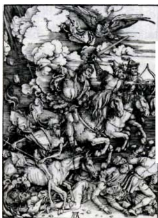
•19. Jh.: Dürer, Die apokalyptischen Reiter

Der harte Lebenskampf wird gelebt in mühseligen Entwicklungsschritten, wie z.B. langsamem, zähem Geschäftsaufbau mit einer geradezu apokalyptischen Neigung zu Rückschritten, in langwierigen Erbstreitigkeiten, wirtschaftlichen Überlebenskämpfen und in komplizierten Schwangerschaften.