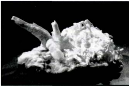
Abb.: Eixi'nhlülü: Fundort Sleiermuirk

Elementares Eisen ist äußerst selten und wird fast nur als Meteoriteneisen gefunden, das vor ca. 6000 Jahren auch die erste Quelle für die Nutzung des reinen Metalls darstellte. Reines Eisen ist silberweiß, weich, dehnbar und ziemlich reaktionsfreudig, weshalb auch kein gediegenes Eisen im Erz vorkommt. Die Gewinnung durch Reduktion mit Kohle erfolgte um ca. 1400 v. Chr. und wurde wegen der vorgefundenen Werkstoffeigenschaften, die z.B. Waffen den bisherigen Bronzeschwertern weit überlegen machten, als Staatsgeheimnis gehütet. Ab ca. 1200 v. Chr. begann mit dem allgemeinen Gebrauch von Eisen die Eisenzeit. Eisen ist nach Aluminium das zweithäufigste Metall. Es tritt zumeist als Oxid oder Sulfid auf. Aus dem Magma abgeschiedene Gesteine enthalten zweiwertiges, die Verwitterungsprodukte dreiwertiges Eisen. Die roten, braunen und gelben Farbtöne des Erdbodens rühren vom \text{Fe}_2\text{O}_3 her.