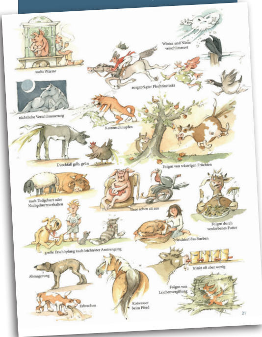
Illustration Arsenicum album, Sebastian Huber

Baumgartner Verlag 24 Homöopathische Mittel, 64 Seiten, Hardcover, Preis: 26,80 € ISBN Nr. 978-3-9819192-4-0 Fax: 0049 (0) 8642 / 5979 965 Email: igari@t-online.de www.nutztierhomoeopathie.de