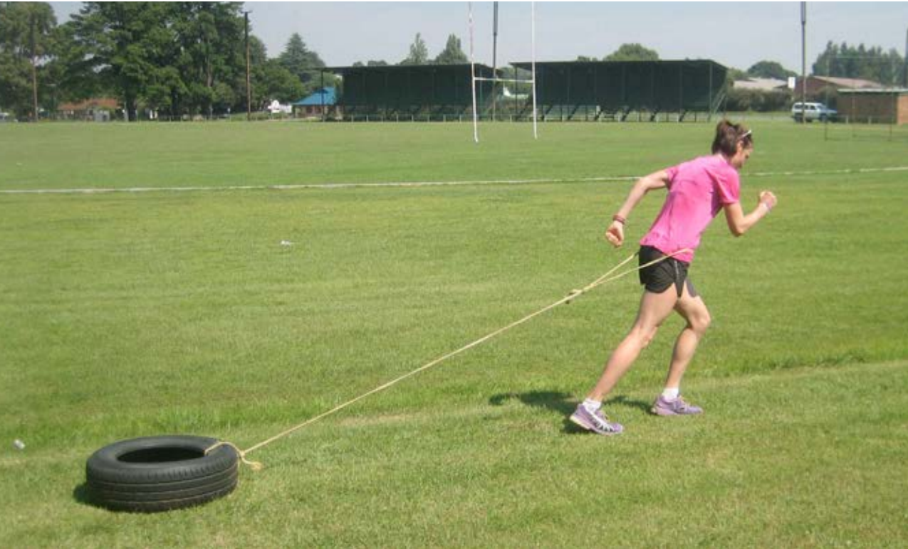
Foto: Zugwiderstände gilt es im Training nur allzu oft zu überwinden.

Das Hochleistungstraining erfordert von den Trainern umfassende Kenntnisse der biologischen Gesetzmäßigkeiten der Anpassung, sowie der Gesetzmäßigkeiten der Spezialisierung des Organismus für eine bestimmte Disziplin des Laufbereichs in einem langfristigen Leistungsaufbau. Damit ist auch das Wissen verbunden, welche Trainingsbelastung mit welchen Pausen, einschließlich der notwendigen Regenerationszeiten, für welche benötigte Fähigkeit erforderlich ist und an welcher Stelle des Jahrestrainingsaufbaus in welchem Zeitraum die jeweiligen Fähigkeiten auszuprägen sind. Zeitverluste in der Leistungsentwicklung lassen sich vermeiden, wenn rechtzeitig Übungen oder Inhalte gewechselt werden, sobald sich der Organismus in der gewünschten Richtung angepasst hat.