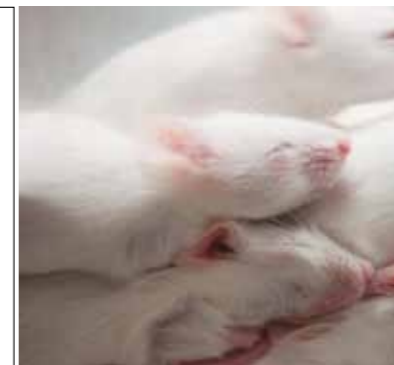
Homöoprophylaxe – Gisela Immich