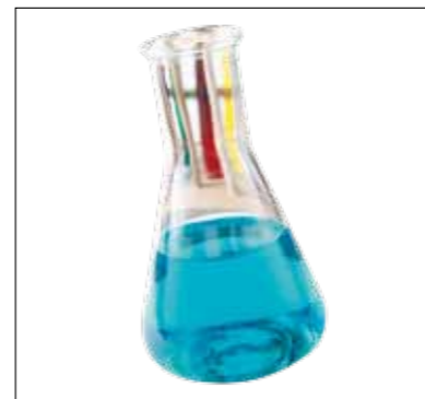
Carboneum sulphuratum – Roger Morrison