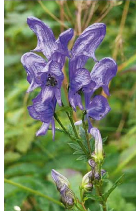
Der blaue Sturmhut fühlt sich dort am wohlsten, wo die Luft schon ein bisschen dünn wird und die Winde rau um die Berggipfel pfeifen. Man findet ihn in Höhen bis zu 3000 Metern.

Genau darin lag mein Problem, als ich begonnen hatte: Welche der circa 200 Möglichkeiten laut Synthesis brauche ich denn wirklich? Bei diesen umfangreichen Rubriken ist wie immer ein Blick in