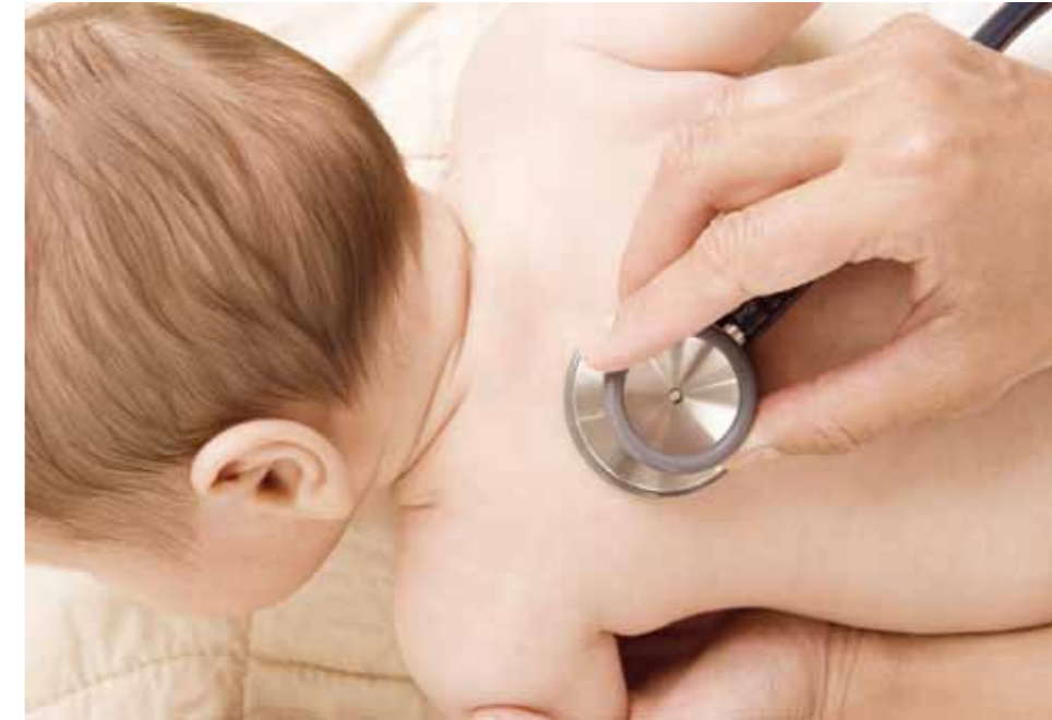
Eine möglichst genaue Diagnose mit Hinweis auf eventuellen Seitenbezug kann helfen, die in Frage kommenden Mittel zu differenzieren. So hat Natrium-Sulfuricum beispielsweise einen Bezug zum linken unteren Lungenlappen.

Wichtig ist halt, dass man diesen Ablauf nicht automatisch als Erstverschlimmerung betrachtet und