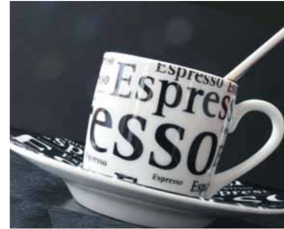
Mit der passenden Arznei sollten auch hartnäckige Kaffeetrinker in den Genuss der homöopathischen Heilwirkung kommen.

Das ist eine gute Ausrede am Anfang, so lange man noch keine passenden Verschreibungen vornehmen oder die Mittelwirkung noch nicht exakt beurteilen kann. Das Problem zum Beispiel mit Kaffee ist, wenn der Patient den Kaffee weglässt, an den sein Körper gewöhnt ist und dann irgendwann wieder einen trinkt. Dann reagiert er natürlich anders darauf, als wenn er ihn weitergetrunken hätte. Also ist es besser, entweder zu hundert Prozent weglassen oder Kaffee weiterzutrinken. Eine Ausnahme wäre ein Patient, der z.B. wegen Kopfschmerzen zu mir käme und mir erklärt, nach Kaffee ginge es ihm immer besser. In diesem Falle bitte ich ihn, den Kaffee wegen der Beurteilung meiner Verschreibung wegzulassen. Erst muss er wieder stabilisiert werden, Stichpunkt „ Psoramarker “ wie Menses, Energie, Schlaf, Stimmung – diese Dinge. Und den anderen Fall der Heilungshindernisse wie Schimmel oder sonstige widrige Umstände, das habe ich so in meiner Praxis noch nie erlebt.