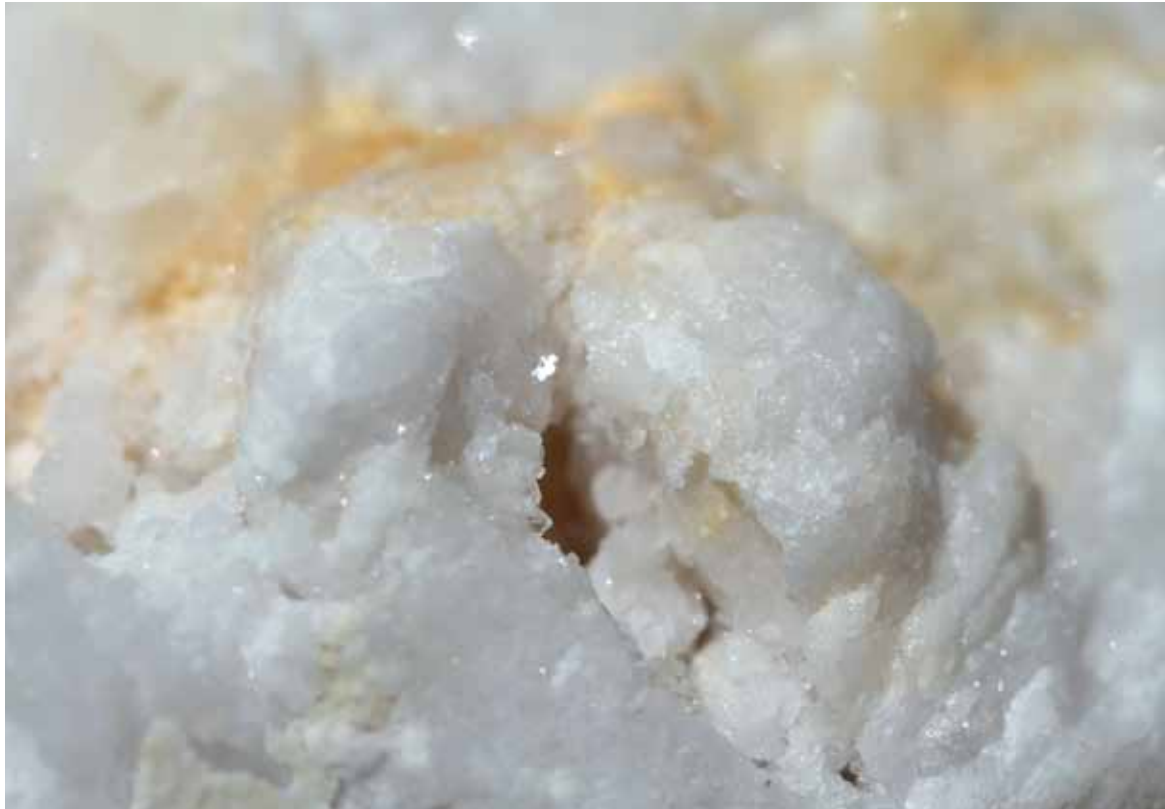
„Silicea ist aufgrund der großen Ähnlichkeit das natürliche Komplementär- bzw. chronische Mittel zu Pulsatilla; es ist ein noch tiefer wirkendes Mittel ...“ (aus: Tyler „Homöopathische Arzneimittelbilder“)

passt, verwandelt er sich in einen Vulkan, der auszubrechen droht: „hitzig und aufbrausend“; „er brüllt laut und aggressiv“; „es stinkt ihm, er faucht wie ein Tiger, fletscht die Zähne, reißt den Mund auf“; „feurig wie ein Vulkan, der ausbricht“.