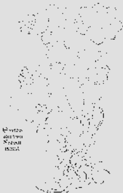
Frauenmanteldarstellung aus dem Kreütterbuch des Otto Brunfels (1532).