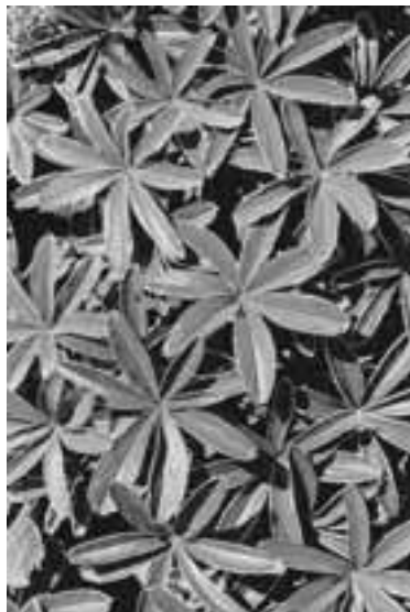
Die Blätter des Alpen-Frauenmantels sind tief gebuchtet und auf der Unterseite dicht silbrig behaart.

Die große Freundin der Alchemilla ist aber die Lärche, der lichteste aller Nadelbäume. Der Frauenmantel bevölkert den gehaltvollen Boden lichter Lärchenwälder. Dadurch, dass die Lärche im Herbst ihre goldenen Nadeln abwirft, düngt sie den Waldboden für den Frauenmantel und schafft überhaupt fruchtbaren Boden für eine artenreiche Flora.