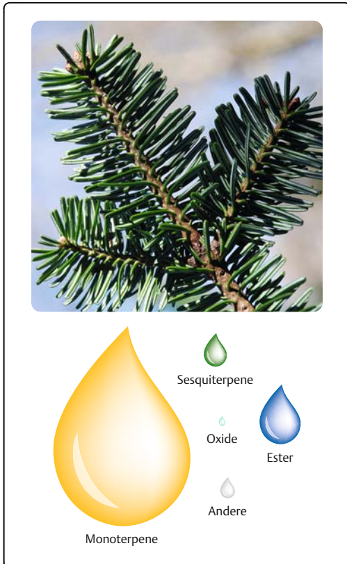
Abb. 7.2 Abies alba Mill.