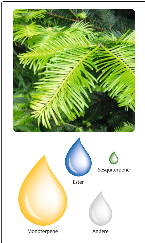
Abb. 7.4 Abies grandis (Doug. ex D. Don) Lindl.