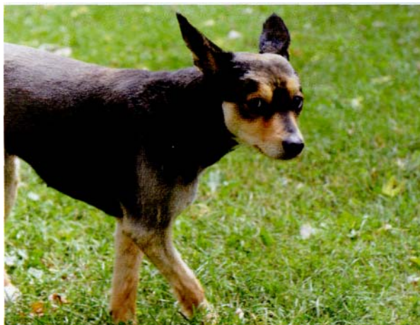
Eine gewisse Nervosität oder Unruhe kann auch durch falsche Ernährung hervorgerufen werden.

Andererseits gerät ein kapha prakriti -Hund durch kaltes Dosenfutter ins kapha vikriti . Dadurch wird er faul, übermäßig schläfrig und hat zu viel Speichelfluss.