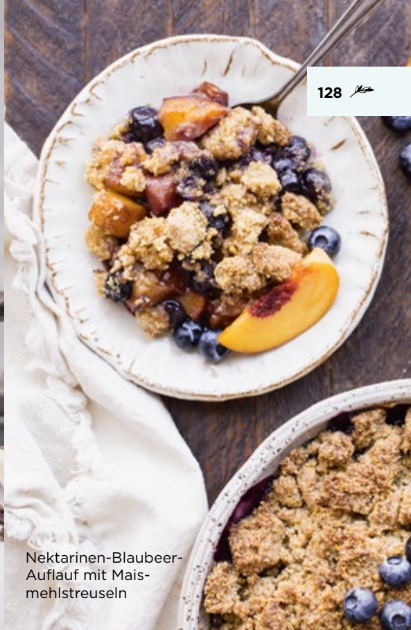
Nektarinen-Blaubeer- Auflauf mit Mais- mehlstreuseln