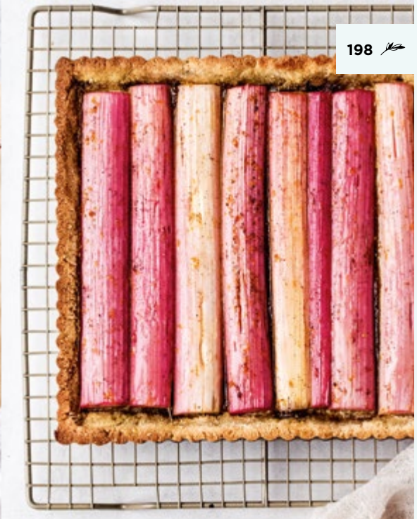
Rhabarberschnitten mit Pistazien-Frangipancreme