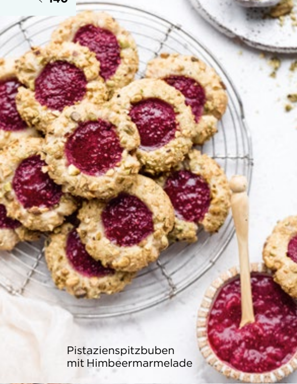
Pistazienspitzbuben mit Himbeermarmelade