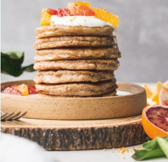
Luftige vegane Pfannkuchen