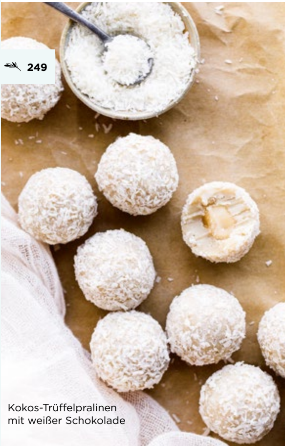
Kokos-Trüffelpralinen mit weißer Schokolade