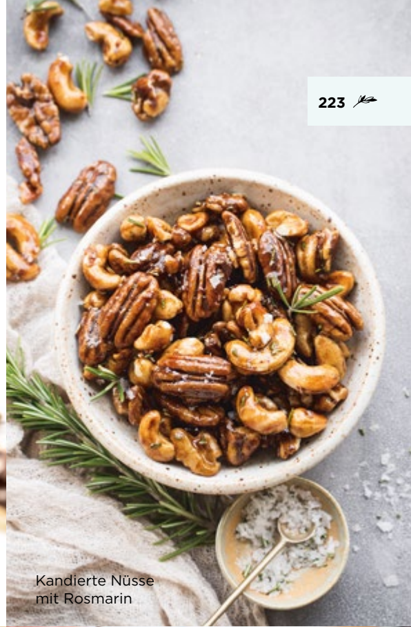
Kandierte Nüsse mit Rosmarin