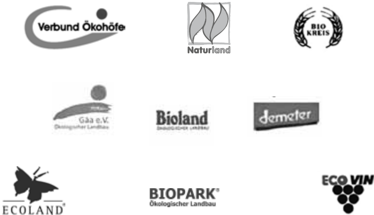
Die Verbandszeichen der ökologisch wirtschaftenden Betriebe _____

So gibt es neben dem EU-Bio-Siegel und dem deutschen Bio-Siegel auch Kennzeichen, Siegel oder Logos der jeweiligen Anbauverbände, die sie auf ihren Produkten zusätzlich zum EU-Siegel anbringen. Diese Verbände heißen: Demeter, Bioland, Biokreis, Naturland, Gäa, Biopark, Verbund Ökohöfe, Ecoland und Ecovin.