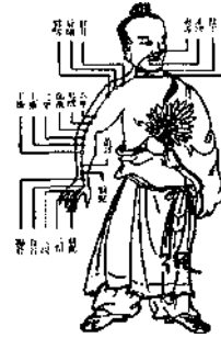
Abb. 5.3 Dickdarm