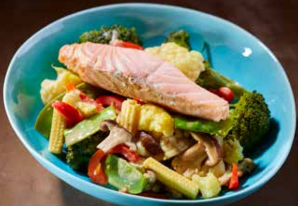
Sesam-Pfanne Szechuan-Art 300