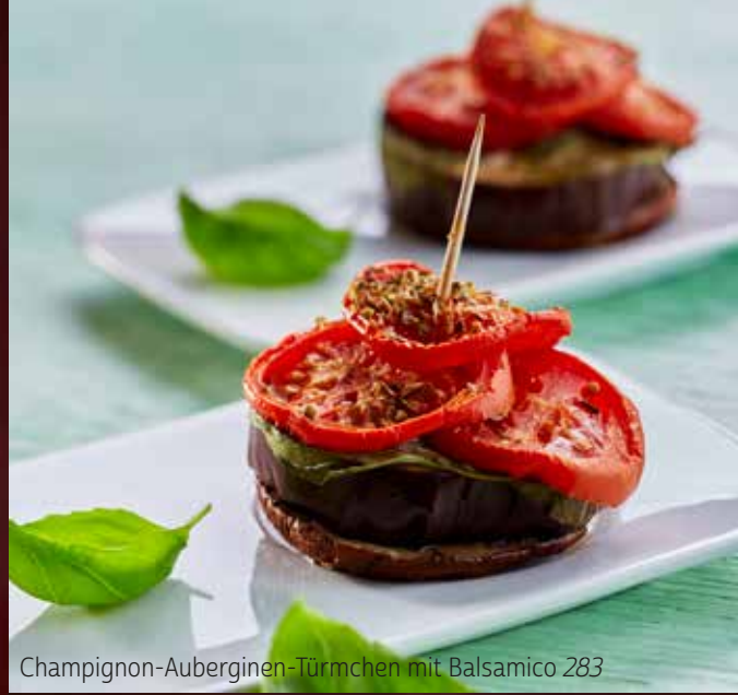
Champignon-Auberginen-Türmchen mit Balsamico 283