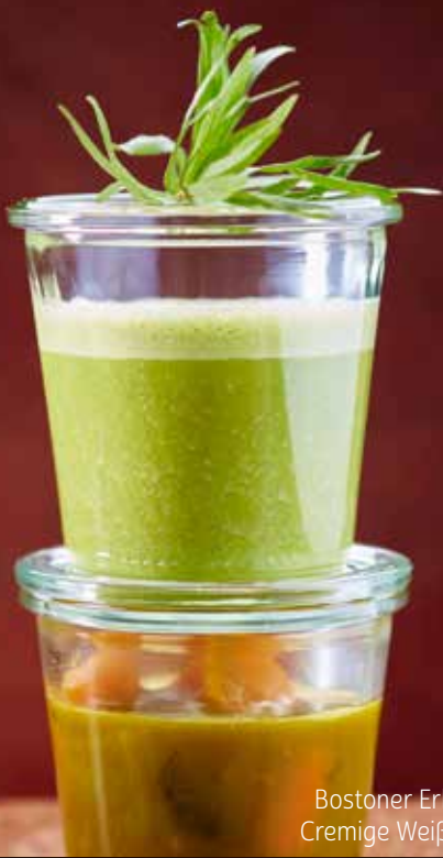
Bostoner Erbsensuppe 269 Cremige Weißkohlsuppe 270