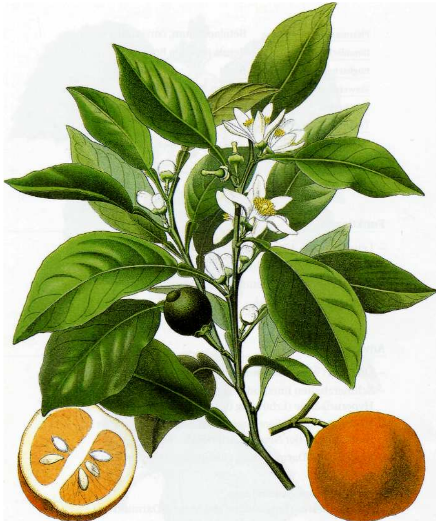
CITRUS AURANTIUM L.