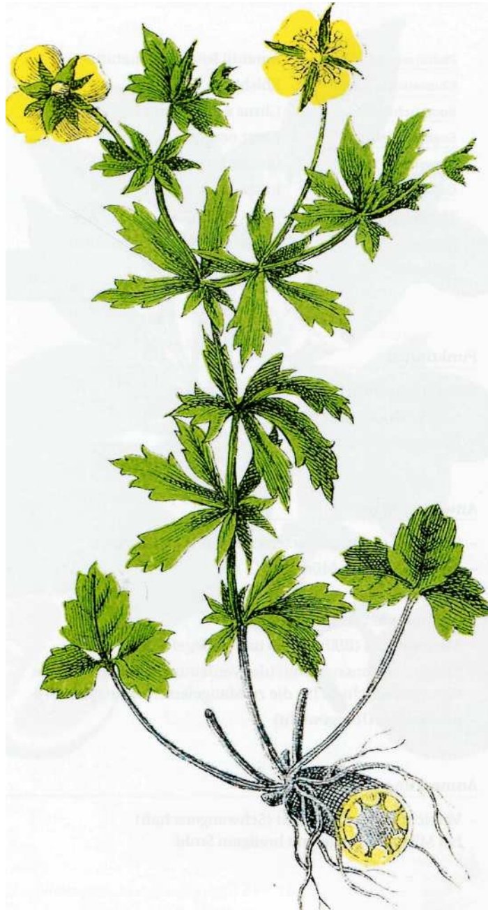
POTENTILLA ERECTA (L.)